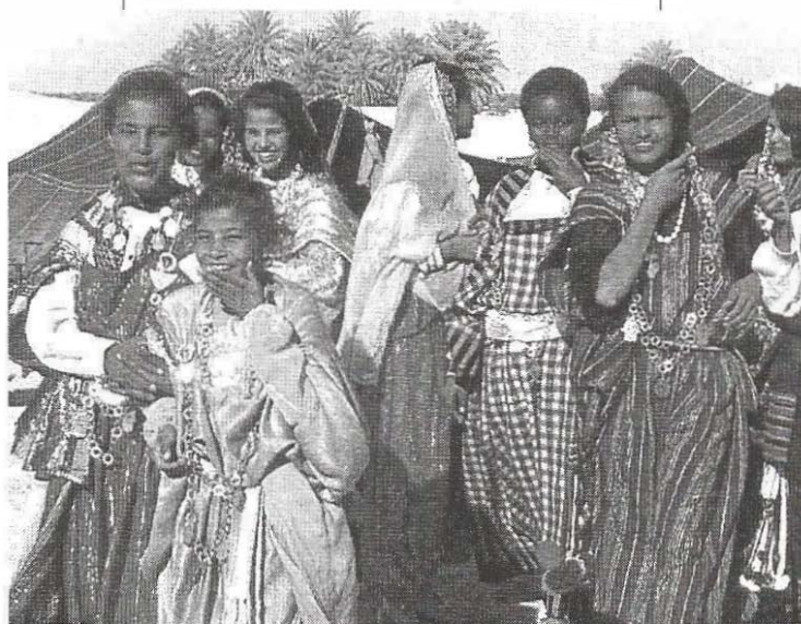
Femmes tunisiennes en costume traditionnel

Mis sur pied en 1992, le ministère de la Femme et de la Famille a été chargé, entre autres, de coordonner l'action des différentes institutions gouvernementales en vue de promouvoir la situation de la femme et de la famille, d'améliorer l'intégration des femmes au processus de développement. Au sein du RCD, nous avons également intégré la femme dans tous les mécanismes du parti, dans les cabinets des ministres et avons tout mis en oeuvre pour intégrer la femme dans la vie publique.